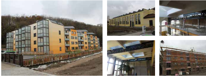
Leistungen ZTKuK: Statik Bestandsgebäude