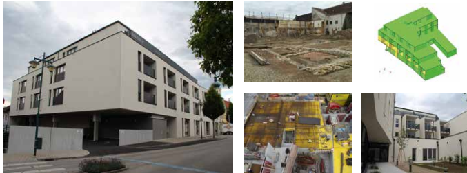
Leistungen ZTKuK: BauKG